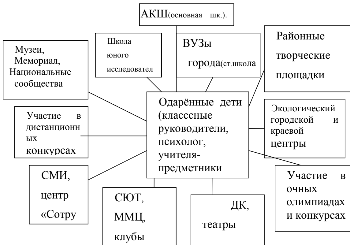
Схема взаимодействия по выявлению и сопровождению одарённых и талантливых детей